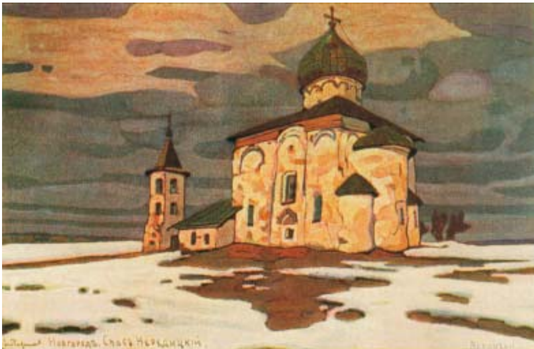
Н.К.Рерих. СПАС НЕРЕДИЦА. 1899

Николай Константинович утверждал, что «человеку, не умеющему понимать прошлое, нельзя мыслить о будущем», потому что только Истоки могут напитать и оживить народное сознание. Он писал: «В древней, самой древней Руси много знаков культуры; наша древнейшая литература вовсе не так бедна, как её хотели представить западники. Но надо подойти к ней без предубеждения — научно». «Нужно знать русско-