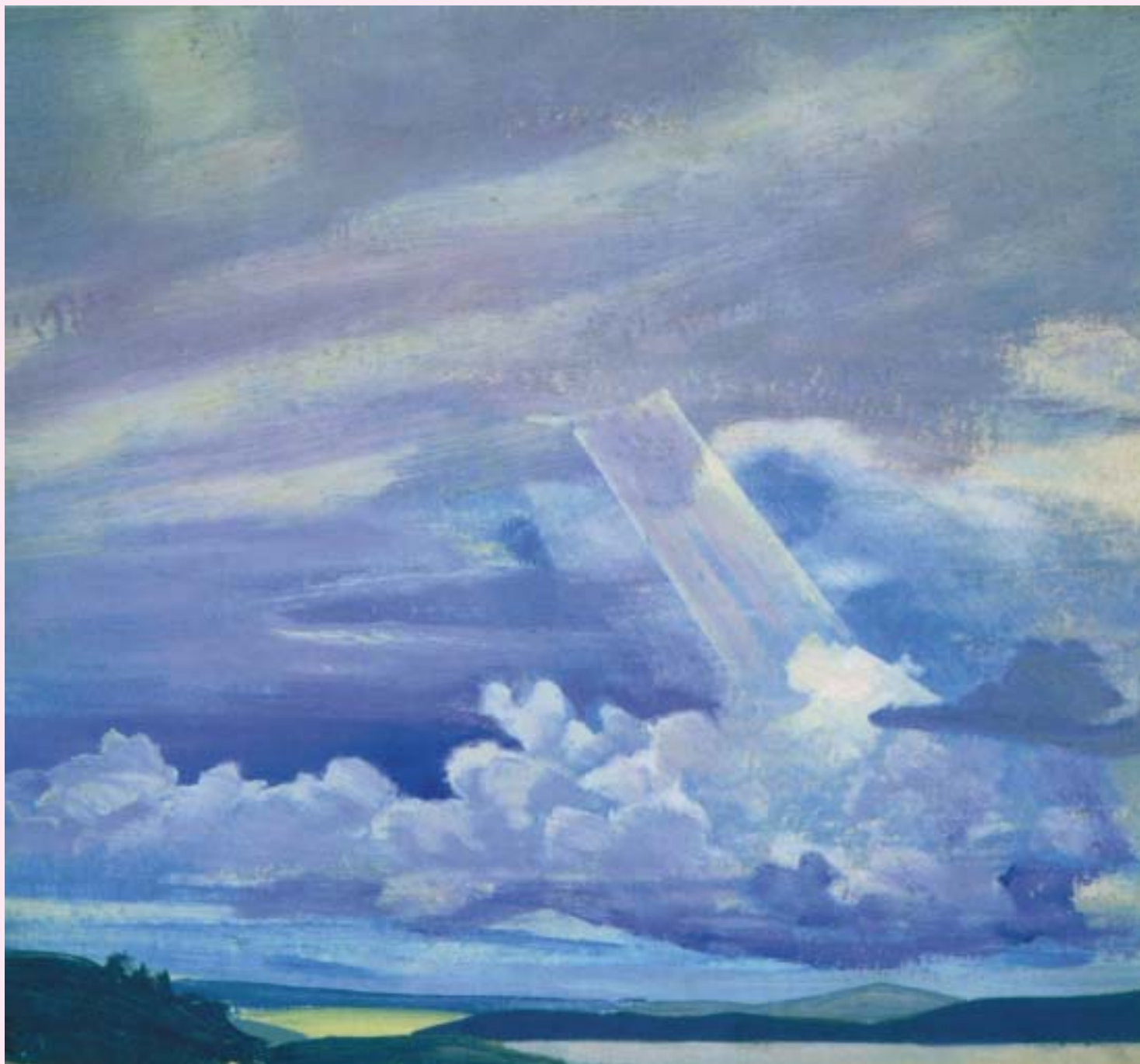
Н.К.Рерих. ОБЛАКА (НЕБО НАД ПРОСТОРАМИ). 1917