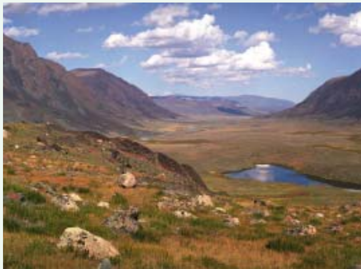
Алтай. Фото В.Д.Кубарева

Вспоминаются слова Николая Константиновича Рериха о его первых археологических раскопках и прикосновениях к предметам старины: «Ничто и никаким способом не приблизит так к ощущению древнего мира, как собственноручная раскопка и прикасание,