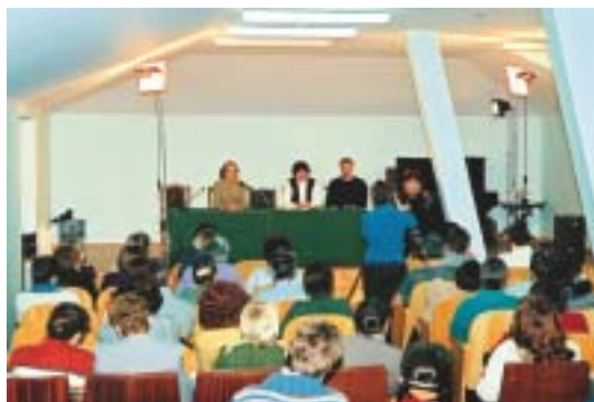
Встреча друзей в новом зале