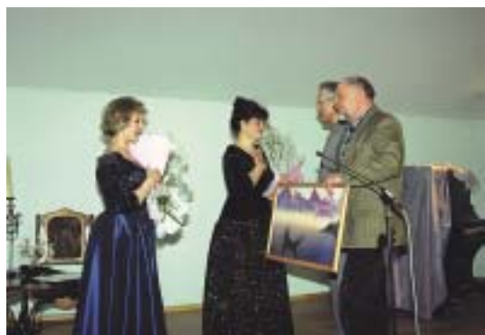
«Благодарим за прекрасный концерт!»