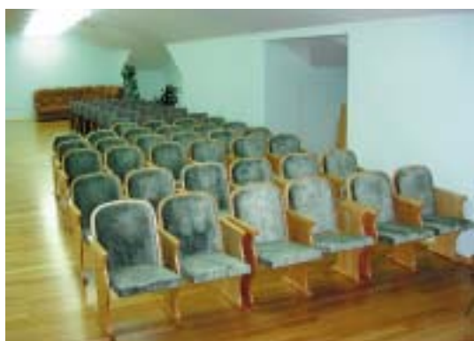
Новые кресла в концертном зале