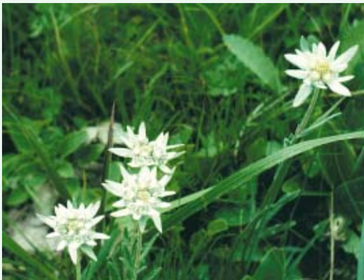
Алтайские эдельвейсы.