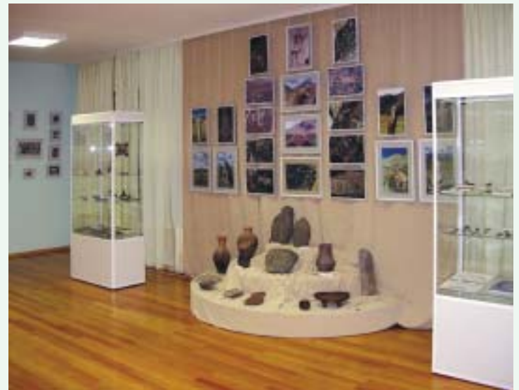
Экспозиция археологических находок