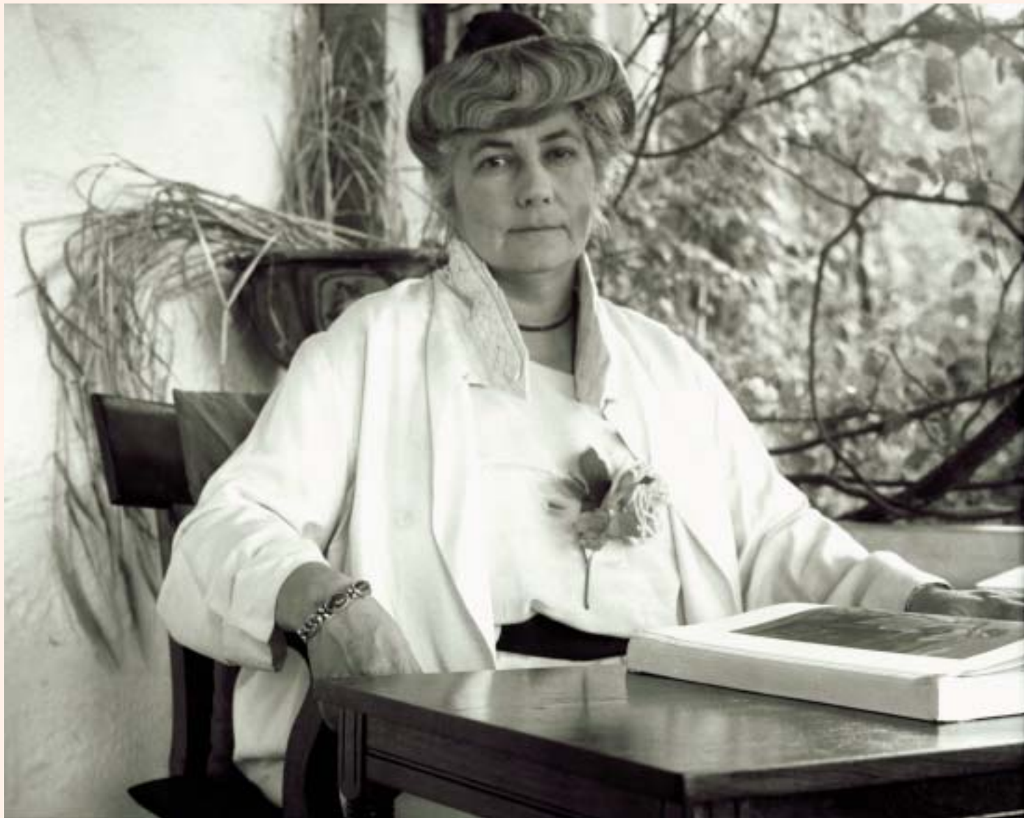
ЕЛЕНА ИВАНОВНА РЕРИХ. Наггар, Индия. 1930-е